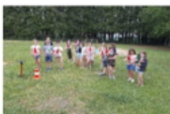
Des fusées à eau