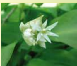
Ail des ours ( Allium ursinum )