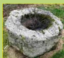
Urne funéraire (Sargnat)