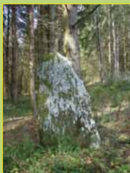
Menhir des Clides (Saint-Amand-Jartoudeix)