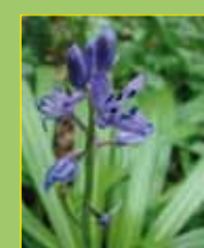
Scille lis-jacinthe ( Scilla lilio-hyacinthus ) de la Forêt d'Espagne