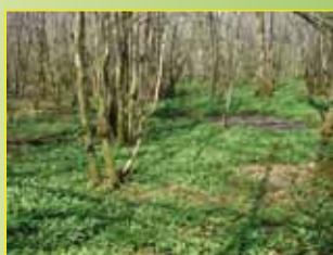
Forêt d'Espagne (Sauviat-sur-Vige, Saint-Martin-Sainte-Catherine, Saint-Pierre-Chérignat)