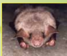
Grand murin ( Myotis myotis )

Vous pourrez également apprécier tout au long du sentier de nombreux points de vue sur le paysage bocager du territoire, notamment au niveau du puy de St-Amand-Jartoudeix.