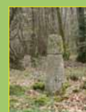
Borne milliaire (Saint-Pierre-Chérignat, Sauviat-sur-Vige et Saint-Amand-Jartoudeix)