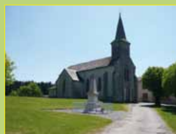
Eglise de Montboucher